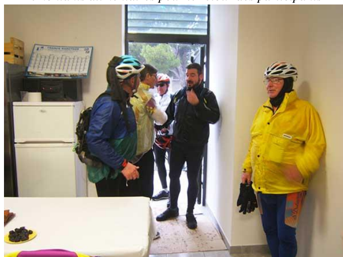
Le retour des vététistes de Fos trempés de la tête aux pieds après leur périple sur le 30km VTT