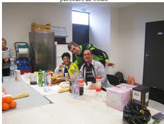
Le trio de Fréjus reprenant des forces après un aller-retour jusqu'à Sénas sur le BF 100km